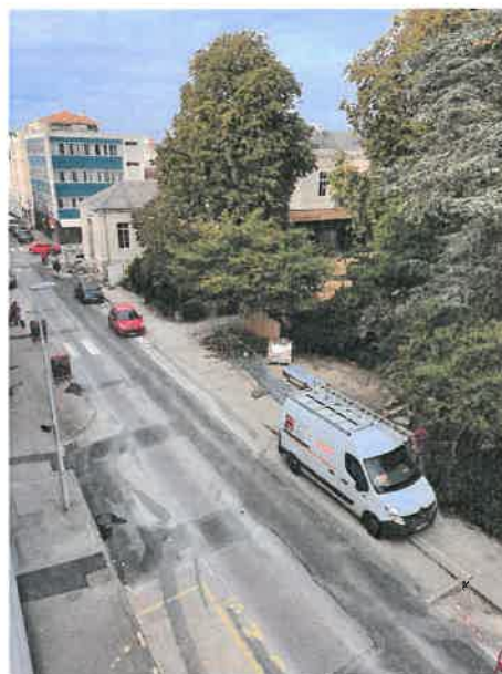
Rue La Fayette