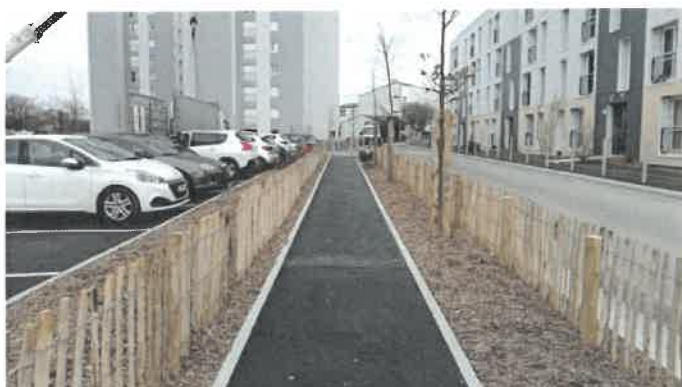
Projet La Vigne-aux-Roses