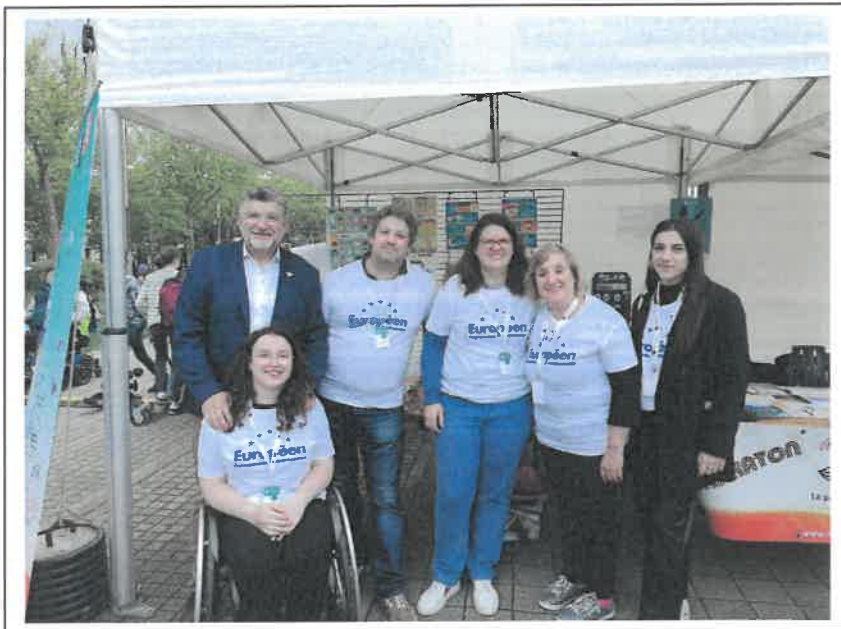
Le Village de l'Europe sur la thématique de l'Europe inclusive, avec la participation de jeunes et des associations (APF France Handicap, Association Valentin Haüy, A pied à pattes, APEDYS, Sourds de Vendée, Makaton)