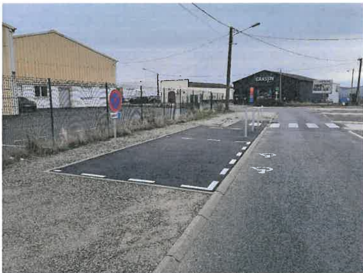
Rue de Montréal, dans le cadre de l'accessibilité aux commerces, avec le terrassement, la pose de bordures, la mise en place des enrobés, le marquage au sol, l'implantation des panneaux, pour un coût de 6 651,47 €

Il faut observer qu'une solution est recherchée systématiquement afin de répondre aux besoins, même s'il n'est pas possible de matérialiser une place de stationnement PMR ou de procéder à un aménagement, considérant les normes réglementaires.