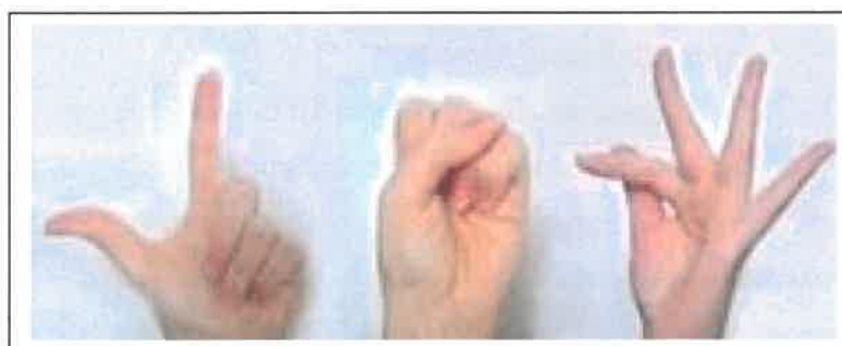
« LSF » en langue des signes française