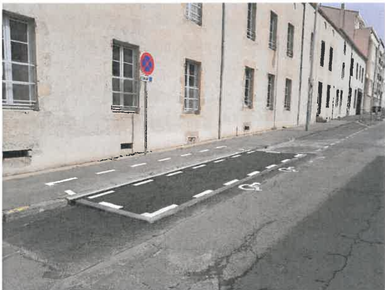
Rue de la Marne, dans le cadre de l'inclusion scolaire, avec le terrassement, la pose de bordures, la mise en place des enrobés, la pose de grilles caniveau, le marquage au sol, l'implantation des panneaux pour un coût de 6243.49 €