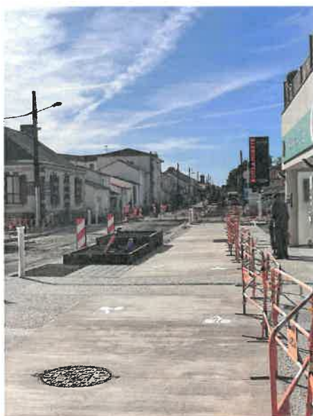
Rue Roger Salengro