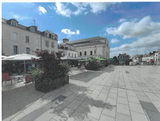
Projet des Halles