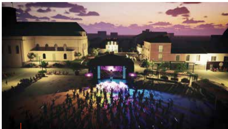
La place du Président Jacques-Chirac animée.

Imaginer, concevoir et réaliser cette ville de demain, voilà la responsabilité que vous nous avez confiée. Nous l'assumons aux prises avec les réalités du temps et face aux contraintes de notre époque, et, vous le savez bien, elles sont quelquefois conséquentes.