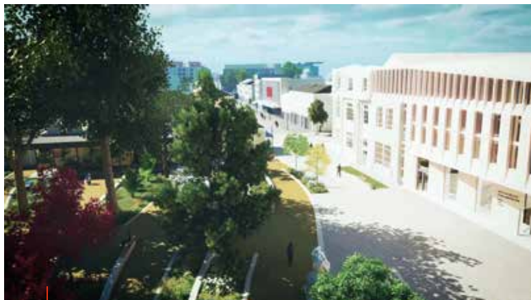
Le nouvel Hôtel de Ville et d'Agglomération.

En presque dix ans, avec mes équipes, nous avons travaillé à réinventer La Roche-sur-Yon. J'ai l'audace de penser que nous avons été plutôt à la hauteur de notre promesse. Celle d'une ville mieux ancrée dans son époque, celle d'un territoire innovant.