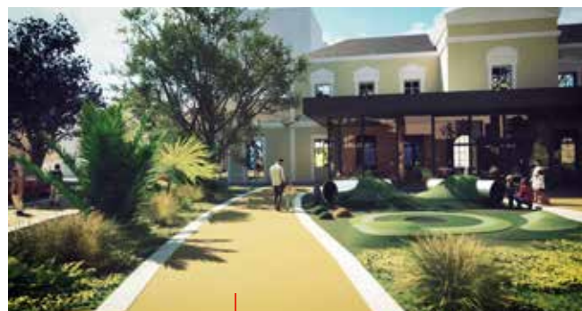
Le nouveau jardin de l'Hôtel de Ville et d'Agglomération.

Parce que, au fond, il n'y a qu'une réalité qui vaille : c'est l'action ! C'est préparer l'avenir de notre ville ! Il n'y a qu'un essentiel qui doit nous inspirer collectivement, c'est "notre ville demain" !