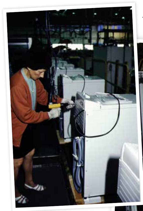
L'usine Esswein aux Ajoncs dans les années 1970.