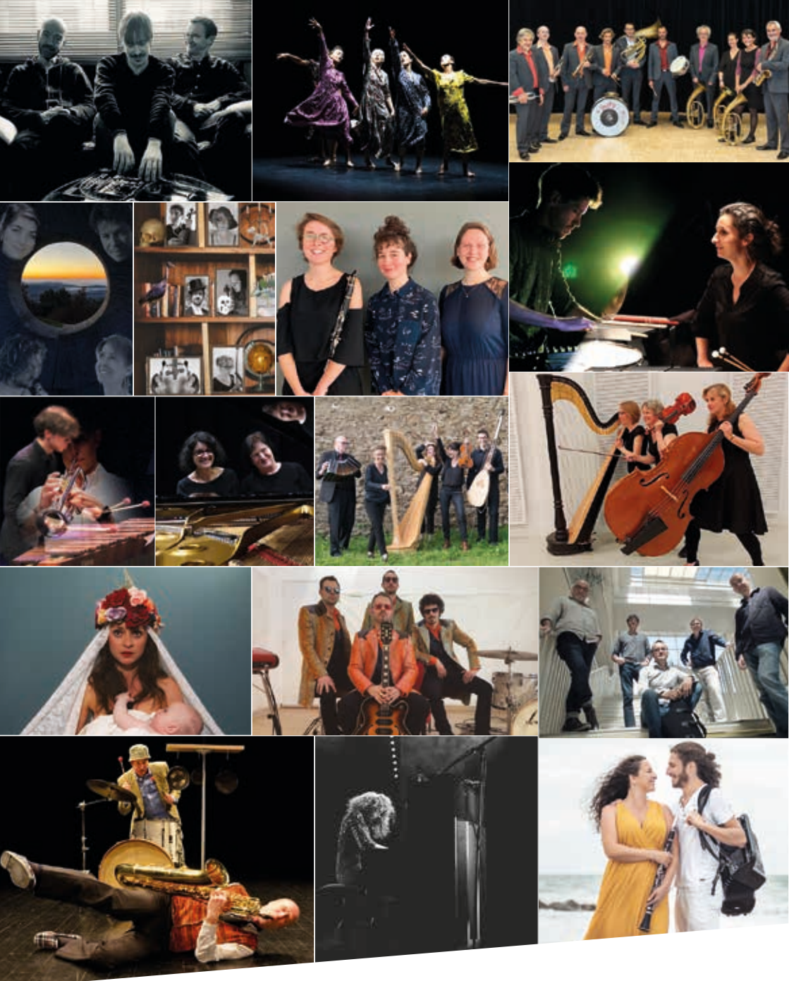
Le Conservatoire – École d'art / Arts plastiques – Danse – Musique – Théâtre de La Roche-sur-Yon est un établissement culturel municipal classé par le ministère de la Culture.